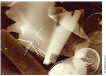
László Moholy-Nagy: Das Fotogramm aus der Zeit zwischen 1925 und 1928 hat den deutschen Foto-Zeitgeist anknüpfen mit einem Bruttoerlös von 487.500 Euro.