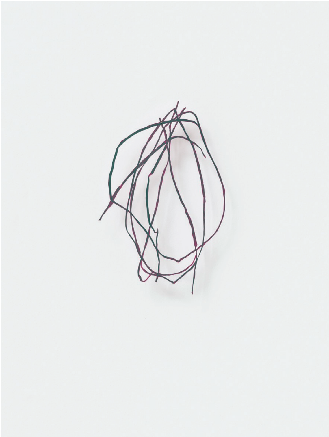
Découpage, 2023 Oil crayon on coloured paper, cut out, pin approx. 20 x 5 cm