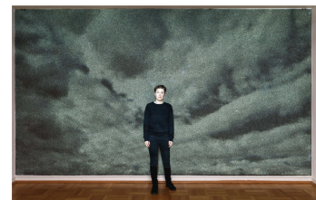
Johanna Jaeger, 2020, Foto: © die Künstlerin und Schwarz Contemporary, Berlin

clouds & pebbles Drawing Room 25.11.2021 – 03.03.2022 von Jens Asthoff