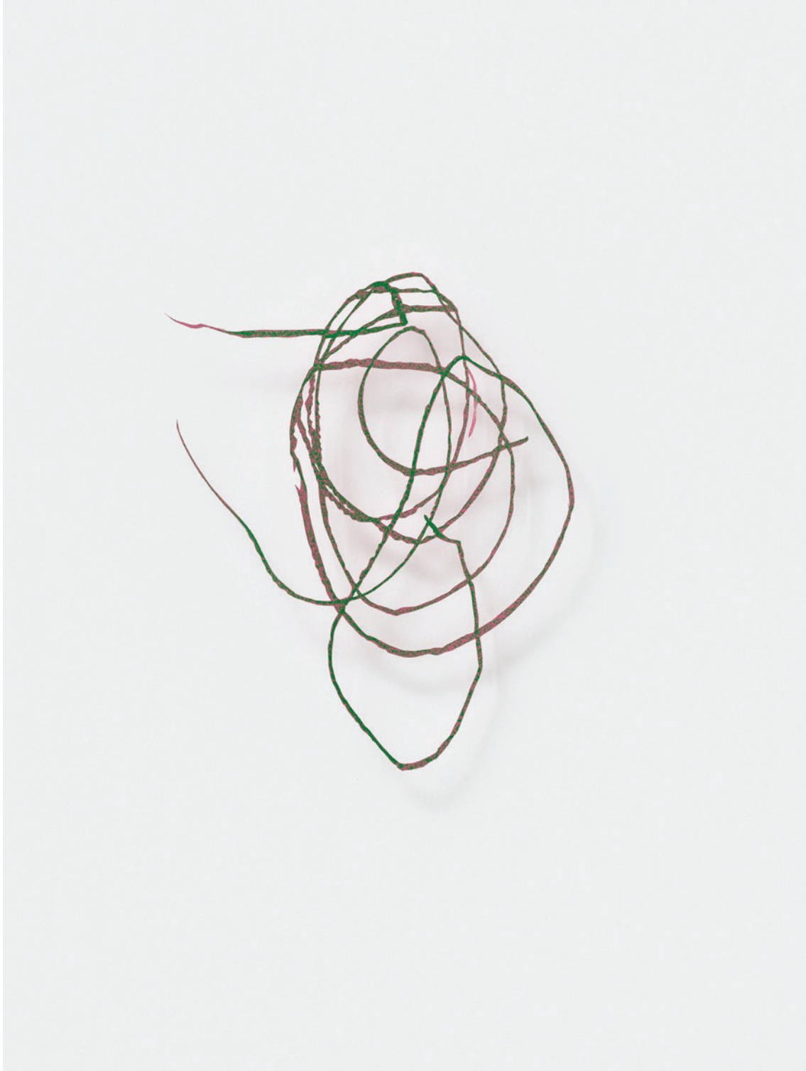
Découpage, 2023 Oil crayon on coloured paper, cut out, pin approx. 20 x 5 cm