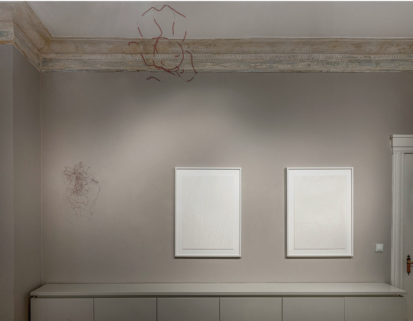
Installation view of Katharina Hinsberg's exhibition Points Coupés at Drawing Room, 2022