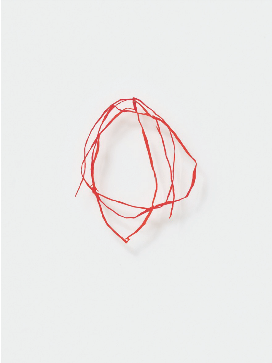
Découpage, 2023 Oil crayon on coloured paper, cut out, pin approx. 20 x 5 cm