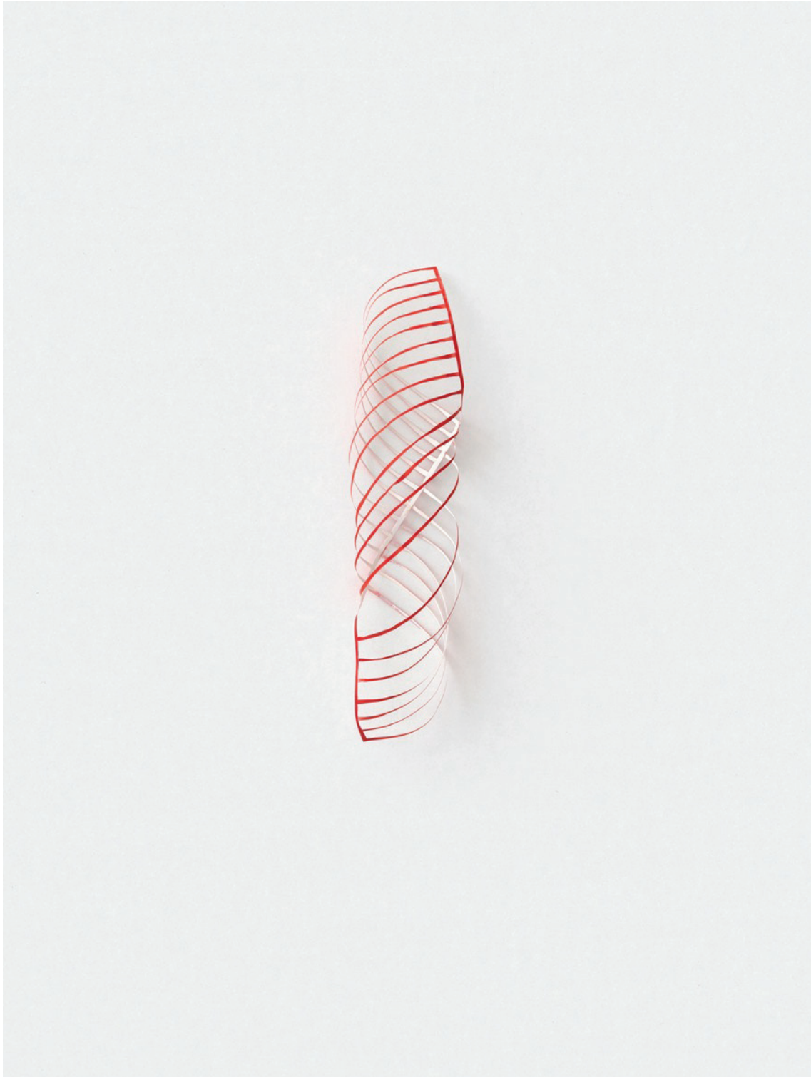
Marginalis (3D), 2020 Ink on paper (DIN A 5), cut out, glued approx. 5 x 5 x 25 cm