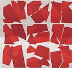
Vera Molnar, Carré coupé en 4 , 2022, collage, 9 pièces. © Vera Molnar. Courtesy de la galerie Berthet-Aittouarès

L'artiste d'origine hongroise, qui fête cette année son 99 e anniversaire, est considérée comme une pionnière de l'art numérique en raison de ses recherches sur la séréalité et le rôle du hasard. Véritable plasticienne, elle explore la ligne, le carré, le blanc, les gris ou les bleus et en fait surgir l'imprévu. La présentation met en lumière un ensemble de 25 dessins réalisés à la table traçante, de 1952 à 2022, ainsi que des collages, une technique omniprésente dans son corpus artistique.